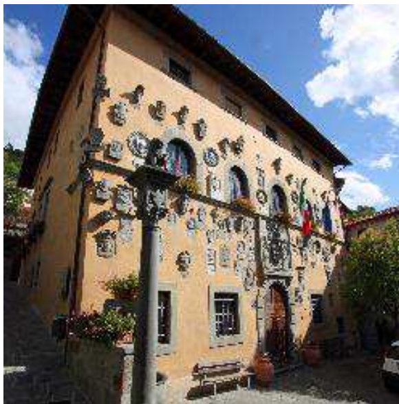
Immagine sede principale