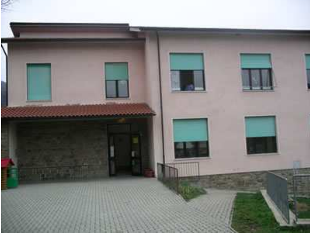
Immagine sede principale