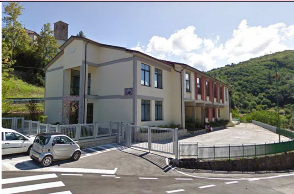
Immagine sede secondaria