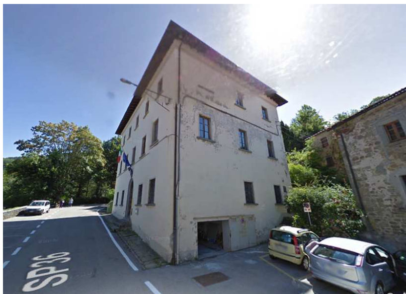
Immagine sede principale